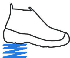
Absorción de impacto (E)

*Para obtener información más detallada sobre cada tecnología, haga clic en el icono.