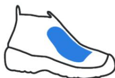
Protetor de Metatarso (M)