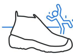
Resistencia al deslizamiento de la suela (SRC)