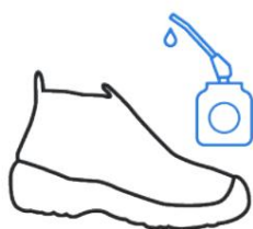
Resistente a Óleo e Hidrocarbonetos (FO)