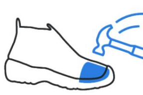
Biqueira de Aço 200J (SB)