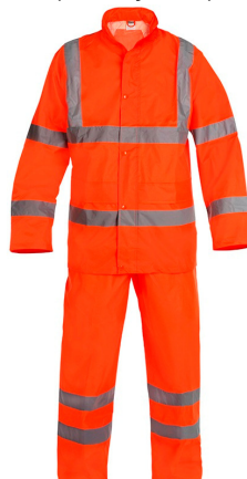
ROHVO (naranja AV)