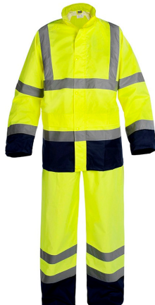
ROHVVYB (amarillo AV/azul marino)