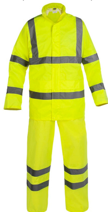
ROHVV (amarillo AV)